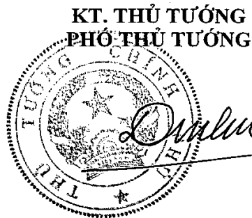
Vương Đình Huệ